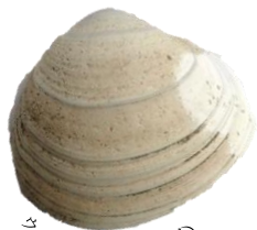
ホッキガイ (ホッキガイ)